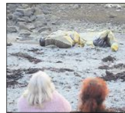
HVA ER DETTE? Et lyst og et rødt hode vet ikke hva de ser.

- Vi opplever et fellesskap mange steder, og det beste eksempelet var kanskje åpningsvandringen fra torget i Breivika. Folk koste seg i lag og opplevde noe i lag, snakket om