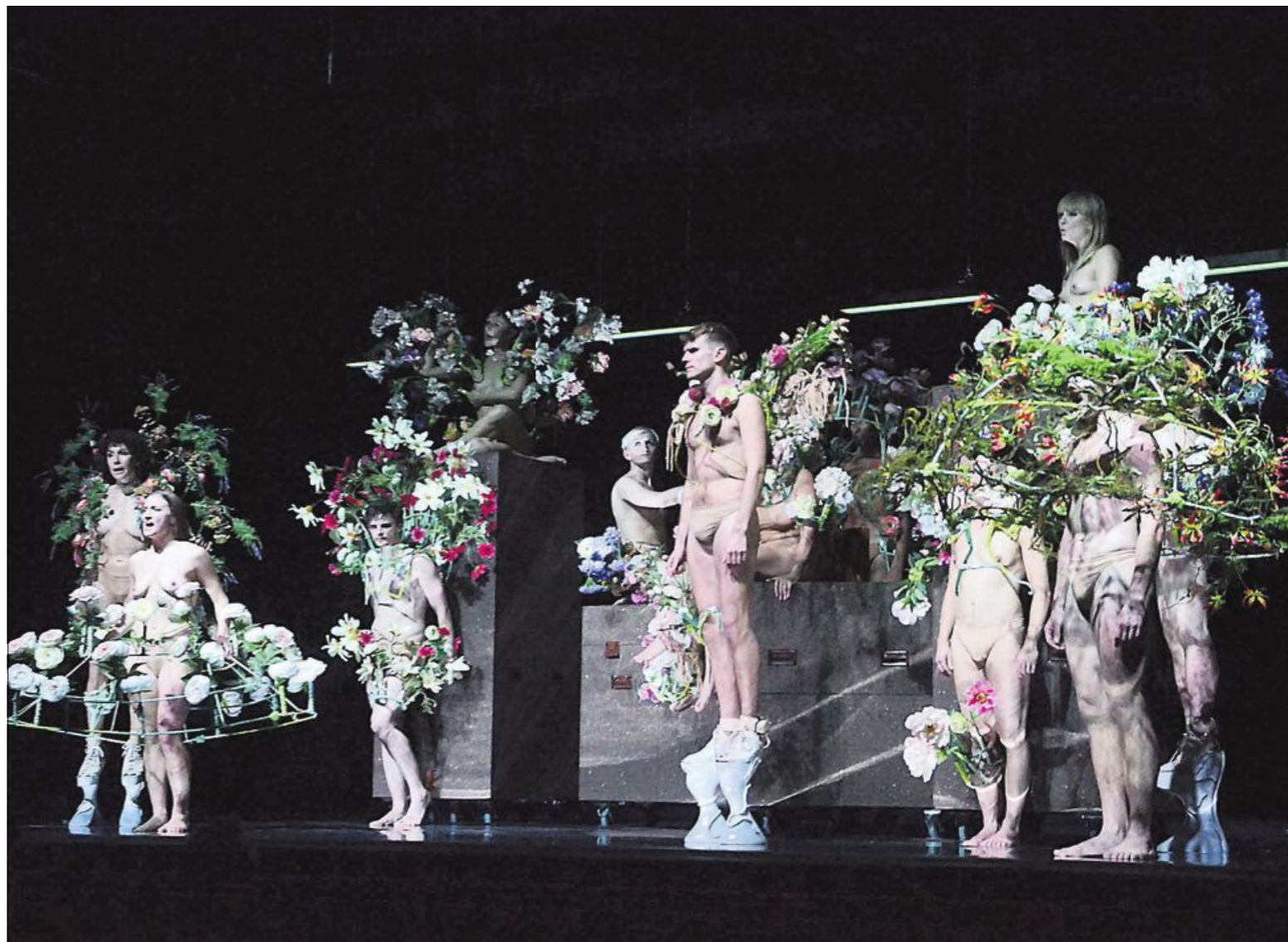
CARTE BLANCHE: De vet hva de vil og de får det til. Med en dyktig koreograf og idémaker og med så høy kvalitet er det bare nødt til å bli førsteklasse. Dessuten viste de til fulle at de kan mer enn å danse. Samtidig som de gjrde det framførte de også temmelig avansert korsang.

- Derfor har jeg en særegen tilknytning til Bodø, sier Nordli. Utstillingene står fram til 21. september.