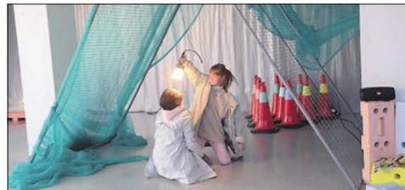
MANGE SLIKE: Biter av byggegjerdet og andre hindre er det mange av i Bodø for tida - så også i «Caprice».

Symbolikken er grei nok, men det ble vel mye av «folkerøysta» og vel mye hopp og sprett og tjo og hei - kuliminerende i en slags brytecamp. Lykke til med neste bestilling.